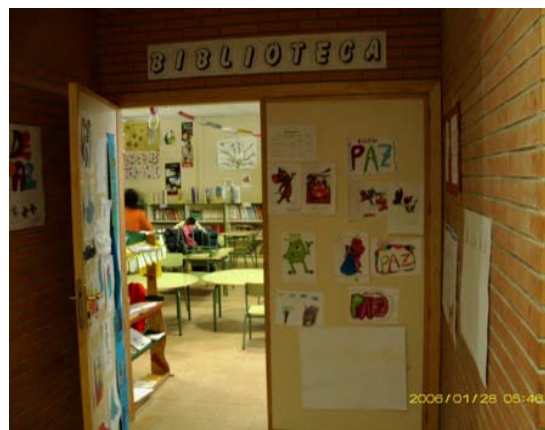
Bibliotecas de Barrio