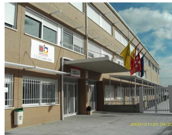
Colegios del Municipio