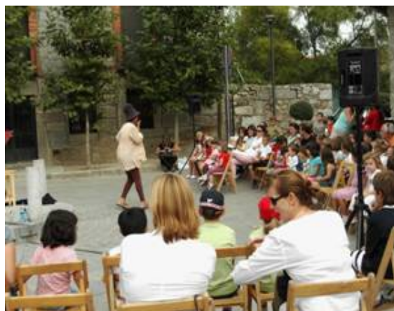
Festival Mucho Cuento