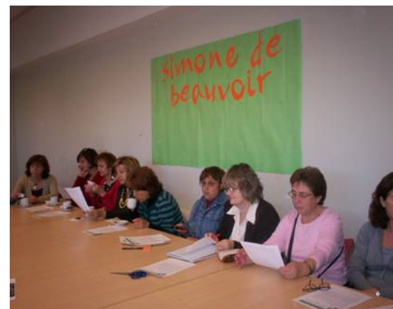
Clubes de Lectura