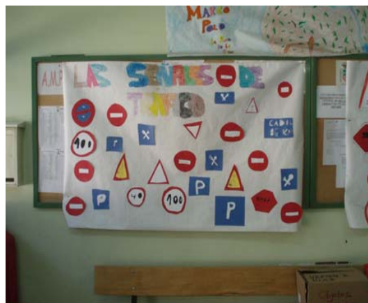
Educación Vial y Campamentos de Verano